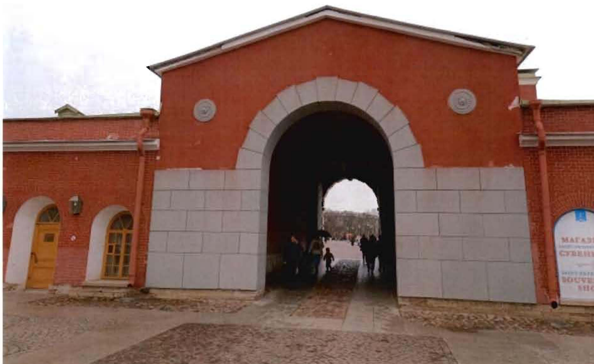
8. Проезд Иоанновских ворот.