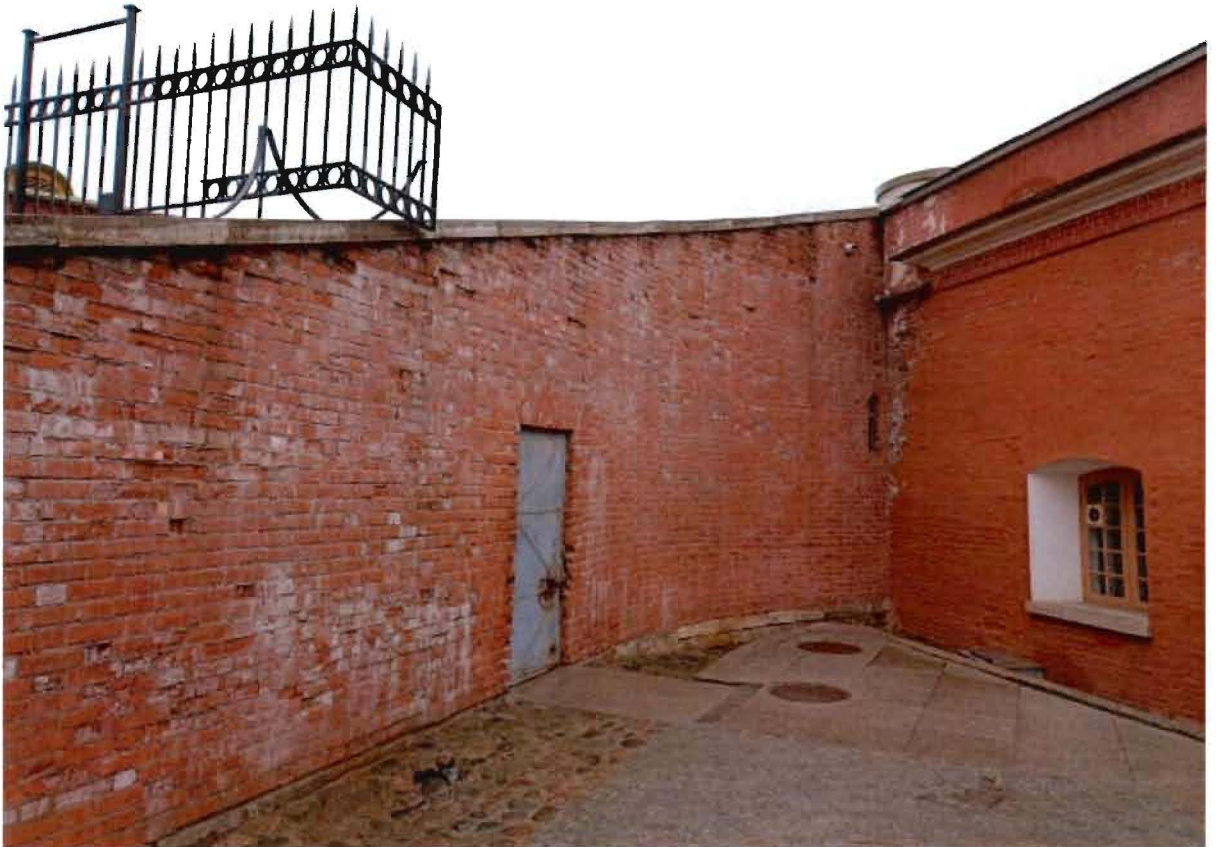
16. Фрагмент интерьера левого фаса.