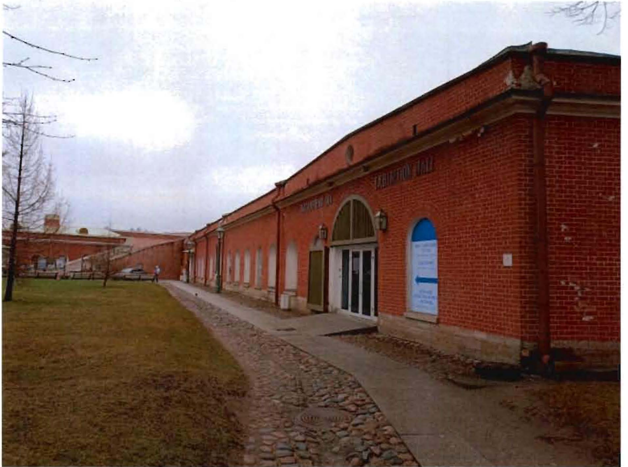
12. Лицевой фасад здания для неприкосновенного запаса Ижорского резервного батальона с воротным проездом.