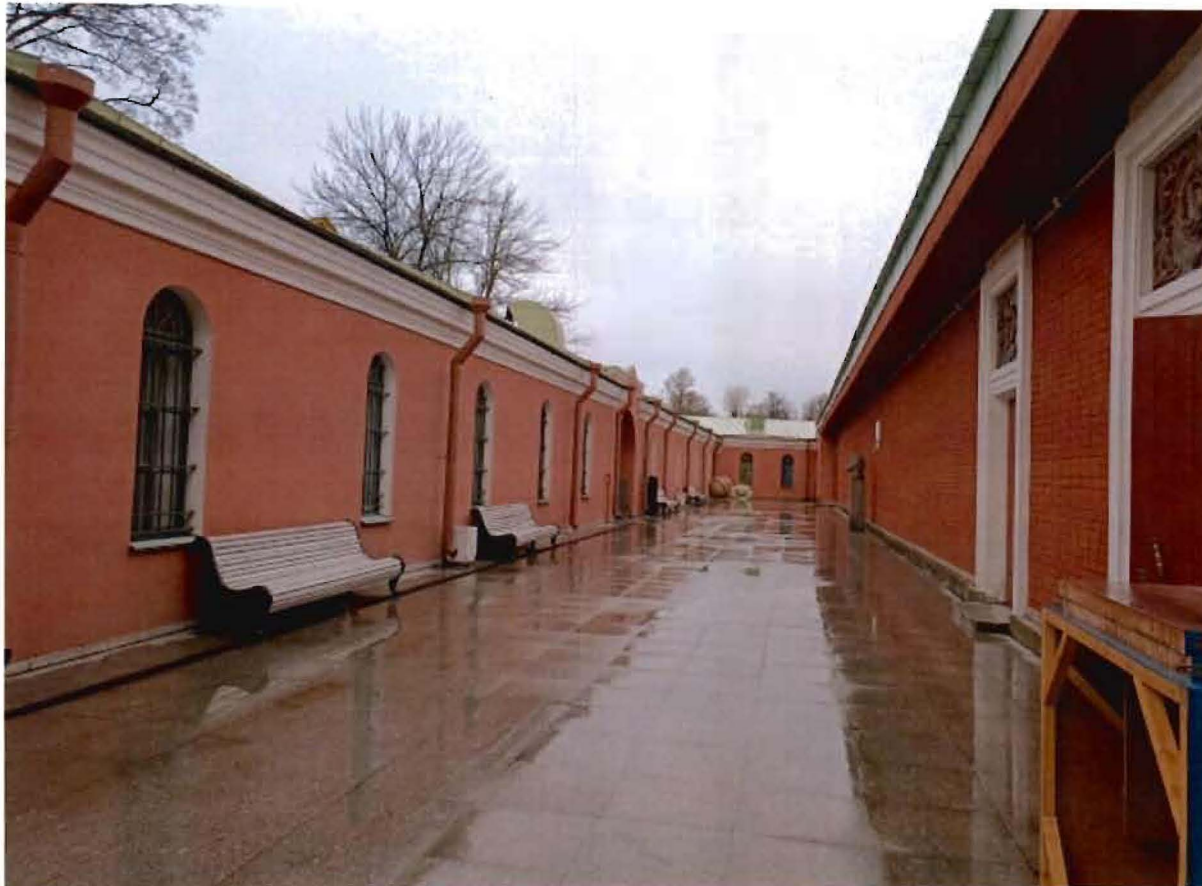
14. Арка проезда здания для неприкосновенного запаса Ижорского резервного батальона.